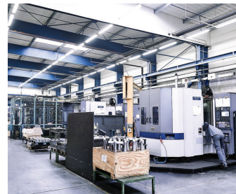
Atelier de production.

Somege travaille pour des secteurs très divers, de l'aéronautique à la défense civile et militaire, le ferroviaire,